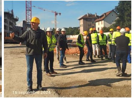
16 septembre 2024