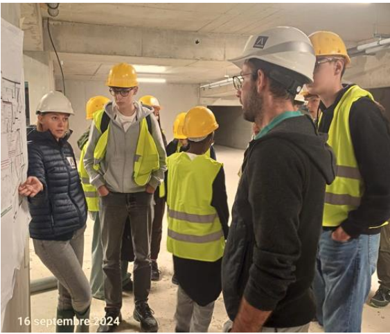
16 septembre 2024