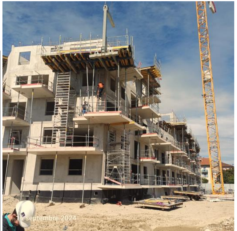
16 septembre 2024